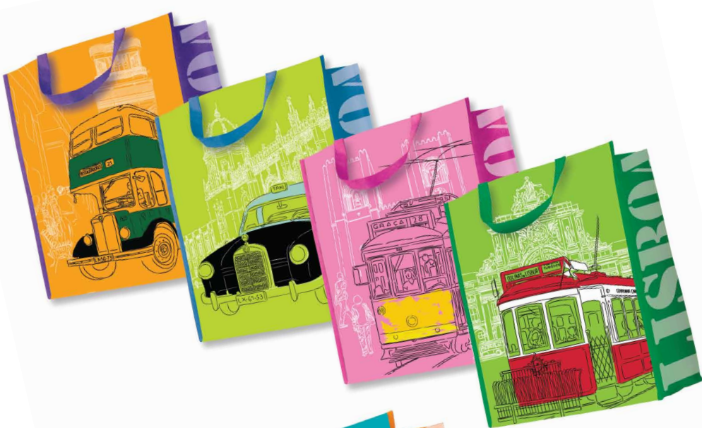
Vertical Shopping Bags