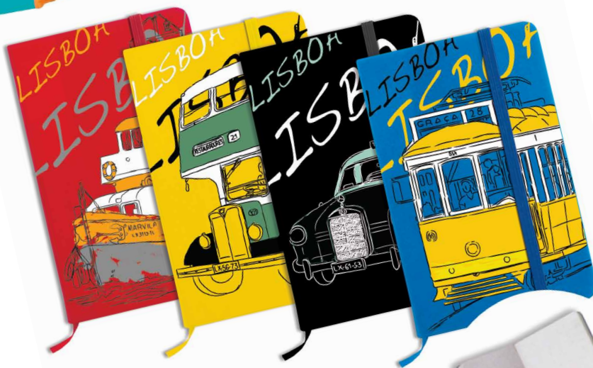
Cilux Bloco de Notas PU (poliuretano)_100 folhas (147mm x 210mm x 15mm)